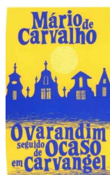
O Varandim seguido de Ocaso em Carvangel de Mário de Carvalho

Na Velha Estalagem, sobre um mar tempestuoso, Ethan e Cathy esperam a chegada do pai. Entretanto, um marinheiro aparece em busca de abrigo, e assim começa uma longa noite de histórias aterradoras... Há algo neste homem que inquieta Ethan, mas ele não sabe o quê. Um livro assustador... Terás coragem para o ler?